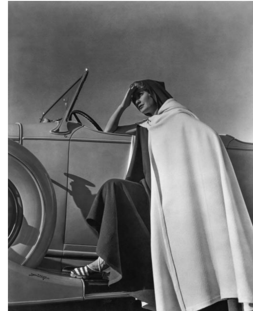
Miriam Hopkins, 1934