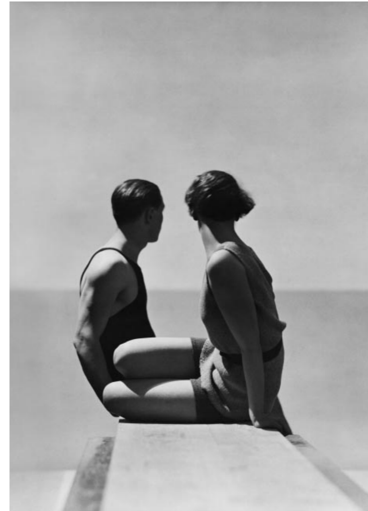
Divers, Swimwear by A. J. Izod, 1930